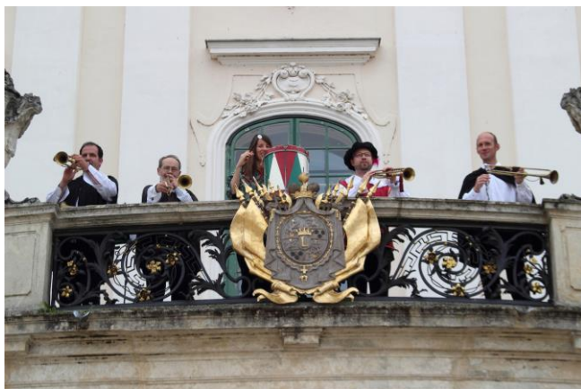
Ünnepélyes megnyitó – Sonatores Pannoniae