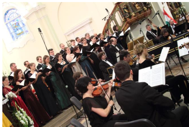
Orfeo Zenekar – Purcell Kórus