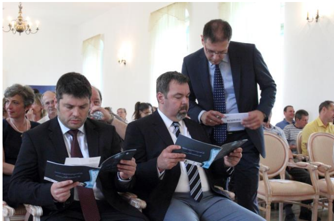
L. Simon László